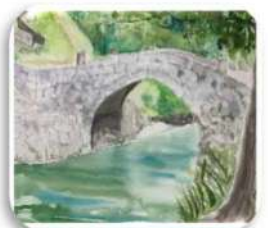
(受講者の水彩画より)