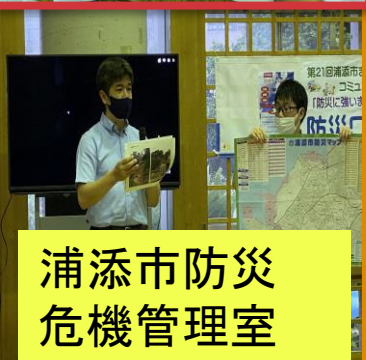
浦添市防災 危機管理室