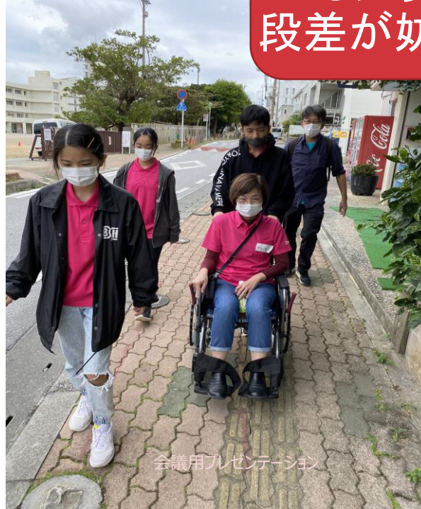
会議用プレゼンテーション