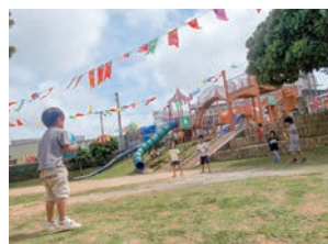
▲まちなと公園で楽しく外遊び

子どもたちの心が豊かになるよう、季節を楽しむ行事や平和学習、食事の文化や大切さを学ぶ行事を行っています。子どもの頃遊びに来ていた子が親となって自分の子連れで遊びに来ることもあります。