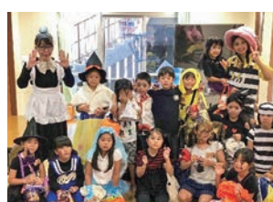
▲ワイワイにぎやかな行事がいっぱい

第2のお家のような居心地のよい居場所づくりを目指した、日々にぎやかなセンターです。未就学児を対象とした「いちごタイム」や、地域と連携した避難訓練、夜間開放時には学習支援と食事提供などを行います。