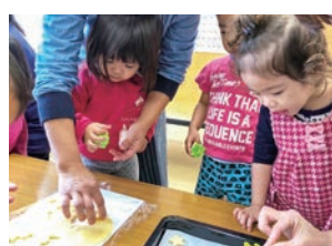
▲親子サークル「びよびよタイム」

毎週火曜日に、妊婦さんや就学前のお子さんと保護者が集まる親子サークル「びよびよタイム」活動をしています。他にもクラブ活動、地域の人との交流行事、子どもたちが企画した行事などを行っています。