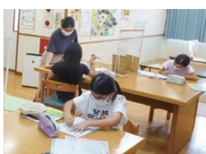
▲小学生対象の寺子屋塾

小学生対象の寺子屋塾や、夜間開放時には中学生対象の学習支援を行っています。子どもたちと一緒に防災訓練や避難訓練をしたり、三線やバイオリンなどのクラブ活動をしたりと盛んに活動しています。