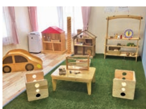
▲木のおもちゃがたくさんあるひろば

赤とオレンジのモニュメントが目印で、太陽(ていだ)の子のように元気に健やかに成長してほしいとの願いが込められています。ホールには美ら海水族館サポートの「海の水槽」や、ピアノ、本などがあり、子どもたちの憩いの場です。