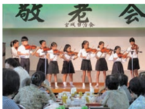
▲イベントで練習の成果を披露!

本センターは今年度で創立20周年を迎えます。クラブ活動で習ったバイオリンや管楽器の音色が行事に参加する人を楽しませます。また、こども食堂で食事の提供を行い、世代を超えて行事・地域交流が盛んなセンターです。