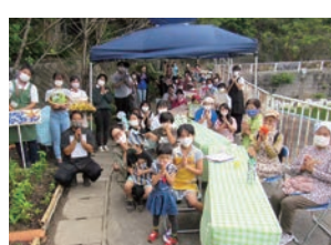
▲地域の皆さんと食卓を囲みます

子ども菜園で種まきから収穫まで行い、自分たちで育てた野菜などを地域の人たちと食べる「地域食卓」を楽しんでいます。地域の人と顔の見える関係づくりを通して、社会全体で行う子育てを目指します。