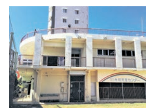
▲カブトムシのような力強い外観

外観には「カブトムシのように強く元気に育ってほしい」という願いが込められています。リラックスできるように木目や芝生などの自然の色で塗られた木育ひろばが人気です。裏の内間ガーデンでは野菜の栽培、収穫体験ができます。