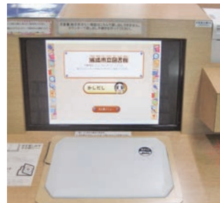
▲画面にはあの、てだ子が!!