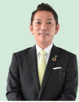
浦添市長 松本 哲治

最近、ワクチン接種に関して「浦添市は接種をおおっている」「松本市長は前のめり過ぎる」「強要されている気分になる」との声を聞きました。私としては決してそんなつもりはありませんが、そう感じる人がいるのなら反省しなくてはなりません。改めて浦添市のスタンスをこちらでも書いておきます。