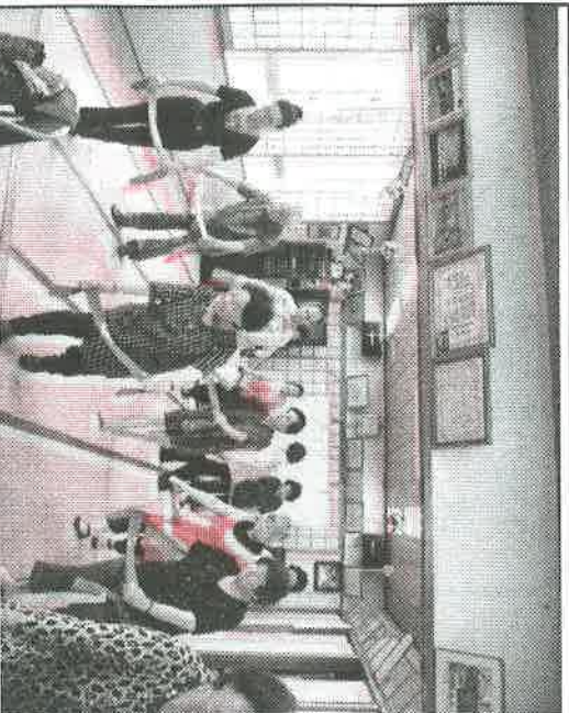
平成26年度浦添市老人クラブ大会に出演まえに公民館にて撮影 老青会長(富里)も出演され15名で糸満かりゆしを演舞しました。懇親会もあり楽しい1日でした。 5/27日