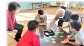
ウサンミー神経衰弱に挑戦!